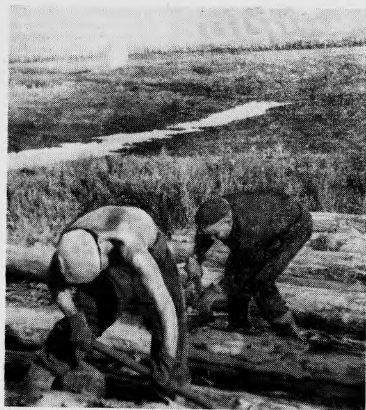
РЕДАКЦИОННАЯ КОЛЛЕГИЯ.